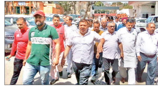
सोनीपत। विरोध प्रदर्शन करते हुए नगर निगम पहुंचे व्यापारी।

■ सुभाष चौक पर रखवाए थे बूथ, नगर निगम महिलाओं के उत्पादों की लगवाएगा प्रदर्शनी