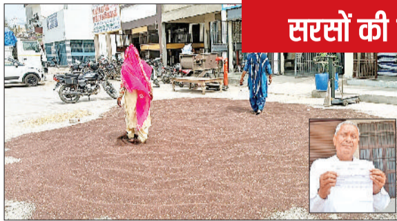
सोनीपत। मंडी में सरसों को सुखाते हुए श्रमिक, रजिस्ट्रेशन दिखाता किसान (इनसेट में) तथा सरकारी कार्यालय में जानकारी लेते हुए किसान।