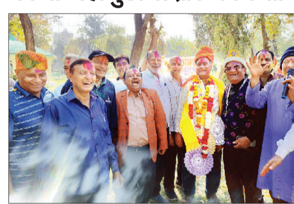
सोनीपत। महामुर्ख की उपाधि से सम्मानित करते हुए क्लब के पदाधिकारी।

फ्रैंड्स लाफिंग क्लब द्वारा होली मिलन समारोह के अंतर्गत महामुर्ख सम्मेलन का हुआ आयोजन