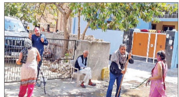
सोनीपत। वेस्ट राम नगर में फाग खेलते हुए।

जिले भर में धुलेंडी का त्योहार धूमधाम व हर्षोल्लास के साथ मनाया गया। शहरवासी जहां होलैंटी और कलबों में डीजे की धुन पर झुमे, वहीं कस्बों और गांवों में डीजे और ढोल की थाप पर लोगों ने जमकर डांस किया और एक-दूसरे को गुलाल लगाकर होली पर्व की बधाइयां दी। युवाओं और बच्चों के सिर होली का उत्साह देखते ही बनता था। सभी ने एक-दूसरे को रंग-गुलाल लगाकर जमकर मस्ती की। सोनीपत शहर के साथ-साथ खरखौदा, गन्ौर, गोहाना, राई में भी रंगों की धूम रही। गांवों में फाग खेला गया और एक दूसरे पर जमकर पानी डाला गया। सुबह से लेकर शाम तक जहां शहर की सड़कों पर हजूम दिखा तो गांवों में भी लोगों ने रंगों के इस पर्व का जमकर लुफ्त उठाया। गांवों में महिलाओं ने होली के रंग को आगे बढ़ाते हुए देवों पर जमकर कोरडे बरसाए।