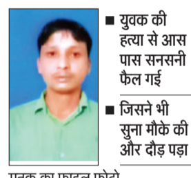
मृतक का फाइल फोटो

आरोपी युवक को उसके कमरे से बाहर खींचकर गली में लाए और चाकू से हमला किया