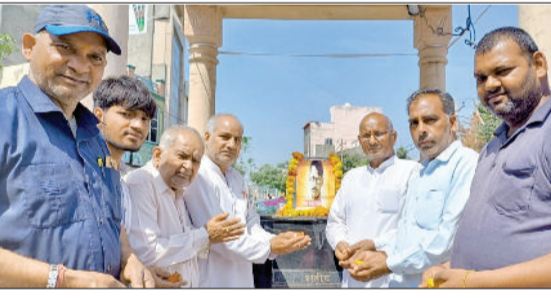
गोहाना। गणेश शंकर विद्यार्थी को नमन करते हुए मोर्चा के सदस्य।