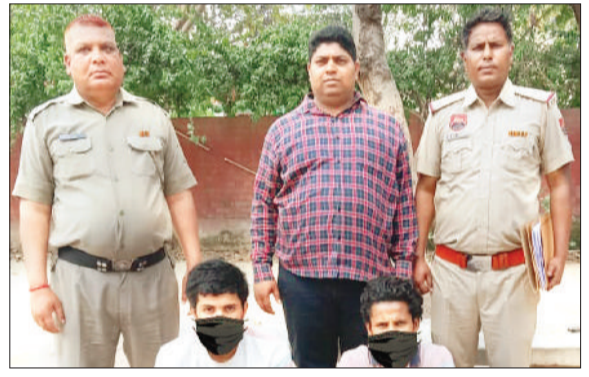
गिरफ्तार आरोपित पुलिस टीम के साथ।