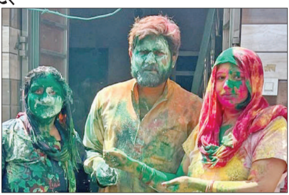
गन्ौर। होली के रंग में रंगे क्षेत्र के लोग।

धुलेंडी का पर्व सोमवार को उत्साह और उमंग के बीच मनाया गया। जगह-जगह खूब अबीर-गुलाल उड़ा। युवाओं और बच्चों में खासा उत्साह रहा। सुबह से रंग का जो दौर चला वह दोपहर तक जारी रहा। शाम को एक दूसरे को गुलाललगाकर गले मिले और होली की शुभ कामनाएं दी। इस दौरान लोगों ने पकवानों का भी आनंद उठाया।