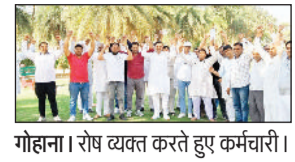
गोहाना। रोष व्यक्त करते हुए कर्मचारी।

मांगें पूरी न करने पर सरकार के खिलाफ रोष गोहाना। शहर में जींद रोड पर स्थित नगर परिषद पार्क में मंगलवार को हरियाणा कर्मचारी महासंघ की गोहाना तहसील स्तरीय बैठक आयोजित की गई। बैठक में गोहाना तहसील के तीनों खंडों खंड गोहाना, खंड मुंडलाना और खंड कथूरा इकाई के कर्मचारियों ने भाग लिया। कर्मचारियों ने इस दौरान लंबित मांगें पूरी न करने को लेकर रोष जताया।